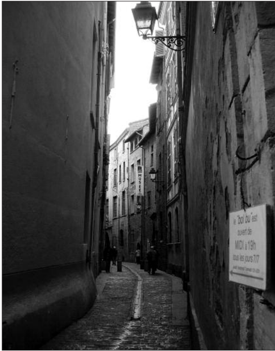
FIG. 1. LA RUE DU MAY depuis la rue Saint-Rome.