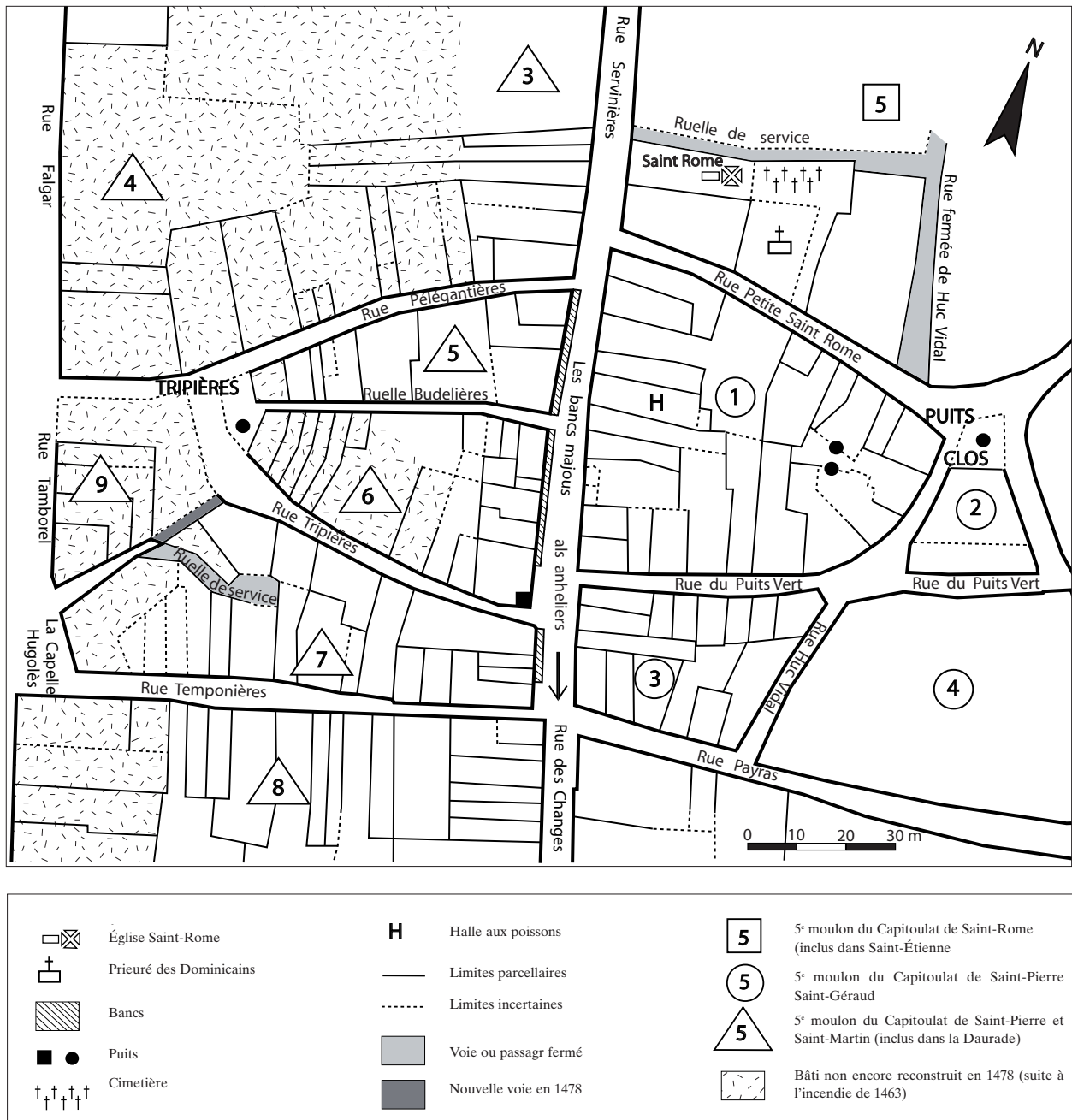
FIG. 6. SITUATION DE L'AMPHITHÉÂTRE dans le cadastre toulousain de 1478 autour des Bancs Majous . Fond de plan H. Molet.