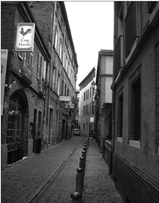
FIG. 3. LA RUE JULES CHALANDE depuis la place des Puits Clos.