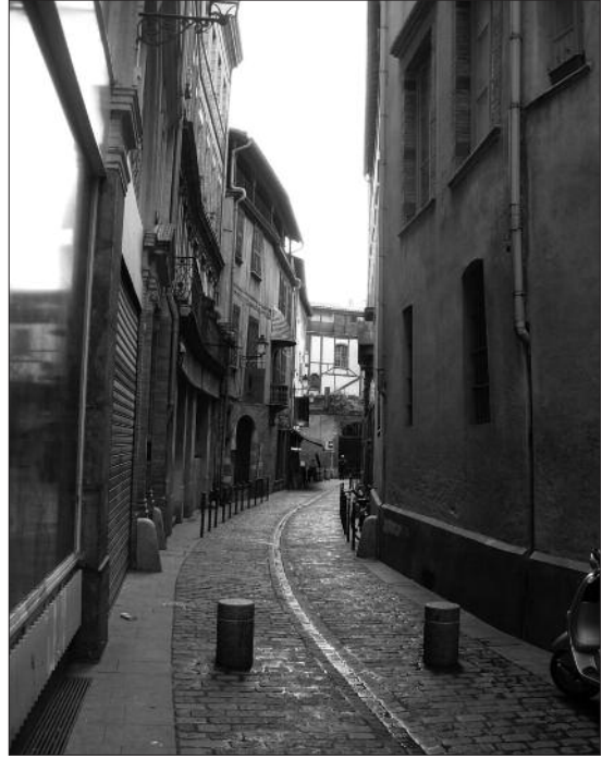
FIG. 2. LA RUE TRIPIÈRE depuis la rue Saint-Rome.