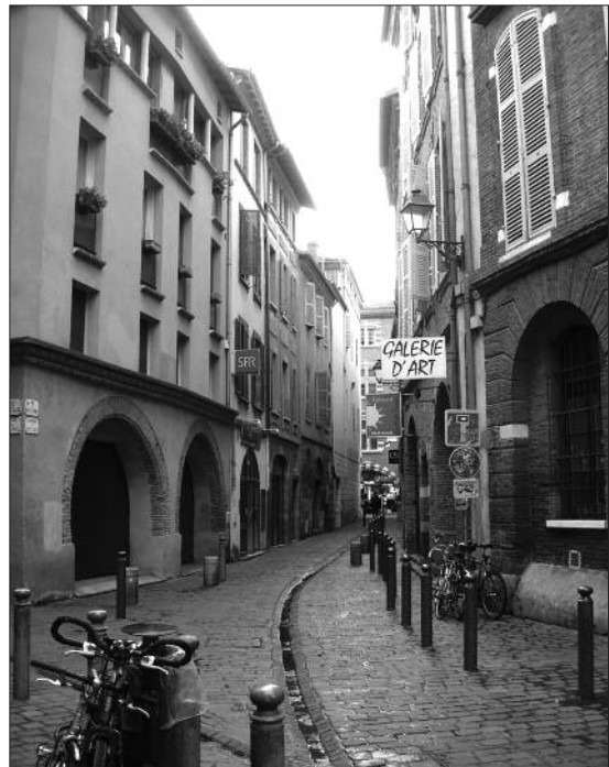
FIG. 4. LA RUE DU PUIITS VERT depuis la place des Puits Clos.