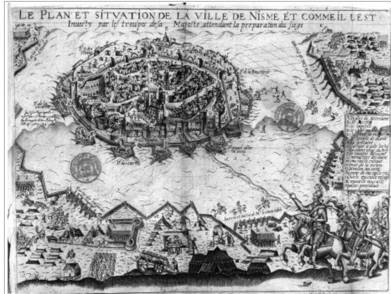
FIG. 12. « LE PLAN ET SITUATION DE LA VILLE DE NISME et comme il est investy par les troupes de sa Majesté, attendant la préparation du siège » (gravure, vers 1622, Paris, Bibl. Mazarine, ms 4418). On notera la position des troupes royales, notamment à droite et en haut le « cartié de M r le duc de Pernon » et en bas « batterie et cartié de M r le connétable » (le duc de Lesdiguières qui avait reçu ce titre peu avant). Sur la gauche, on voit la Porte de la couronne, protégée par le bastion qui fut l'objet des premières démolitions.

bastion placé devant la porte de la Couronne. Mais le registre des délibérations consulaires, où ces travaux sont consignés, mentionne plus loin qu'à l'assemblée qui se tint le dernier jour de novembre 1622, on fit part de la mort du « sieur de la Touche, commissaire nommé pour surveiller lesd démolitions » (60).