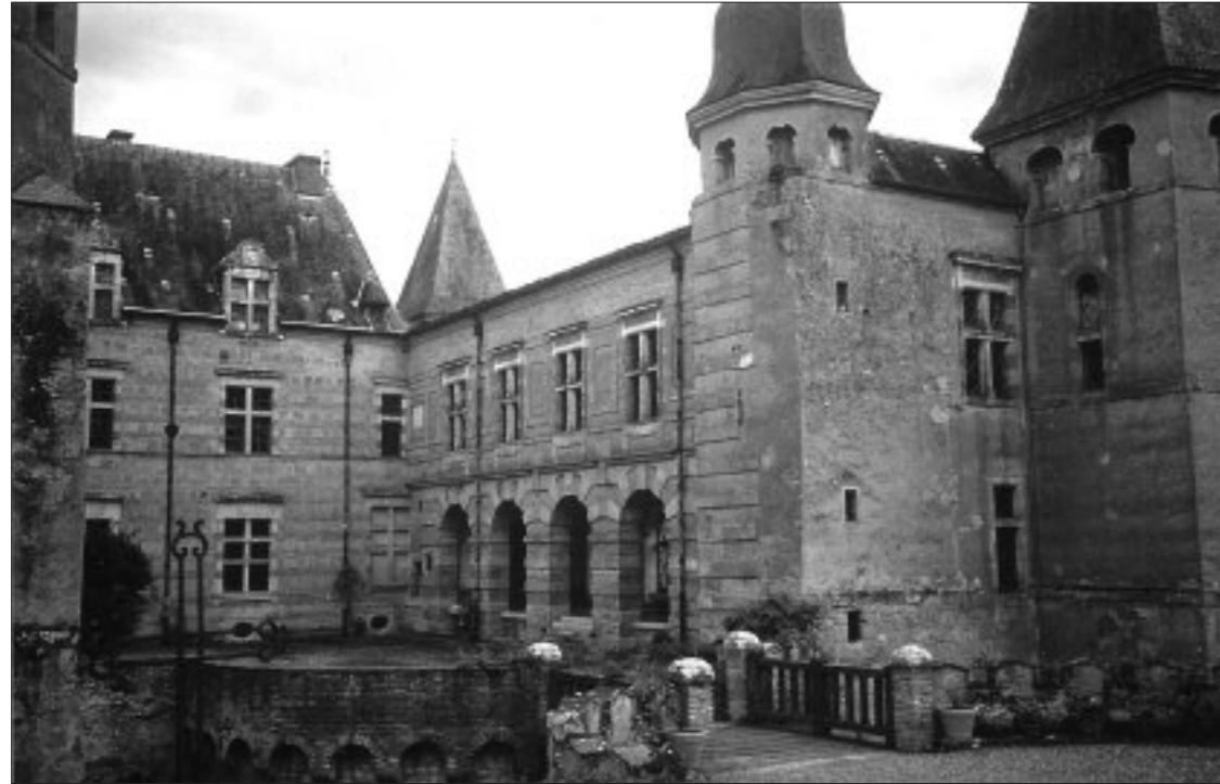
FIG. 10. CHÂTEAU DE CAUMONT. VUE DE LA FAÇADE DE L'AILE SUD.