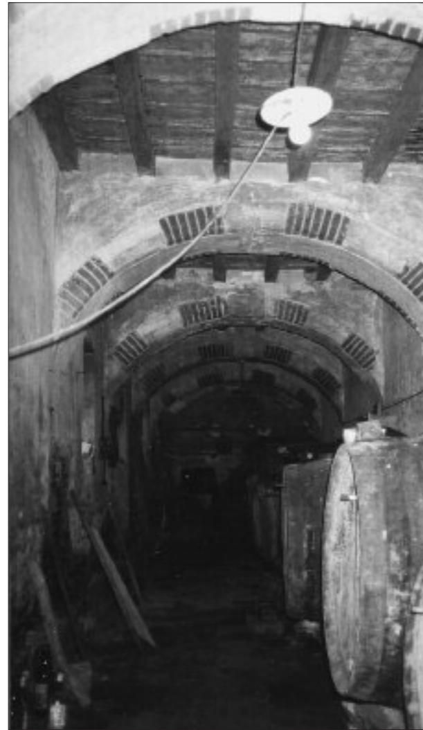
Fig. 7. CAZAUX-SAVÈS. INTÉRIEUR DE L'ANCIENNE GALERIE DU CLOÎTRE. État actuel.