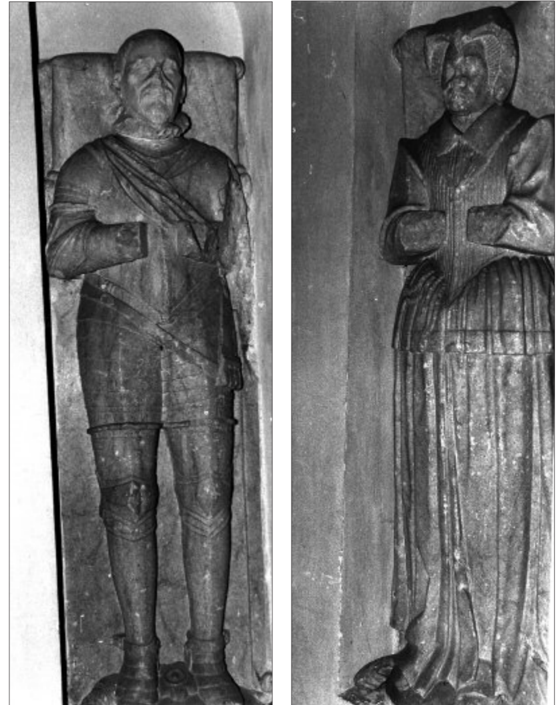
FIG. 3. CAZAUX-SAVÈS. GISANTS DES PARENTS DU PREMIER DUC D'ÉPERNON, provenant de leur tombeau dans l'église des Minimes de Cazaux (aujourd'hui dans la chapelle du château de Caumont).