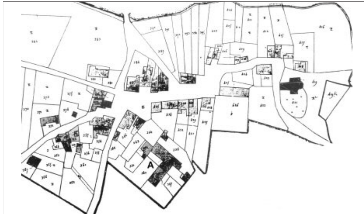
FIG. 1. CAZAUX-SAVÈS. PLAN CADASTRAL DU VILLAGE (1834). L'aire de l'ancien cloître du couvent des Minimes est indiquée par les deux bâtiments joints en équerre (en A) (photographie retouchée par infographie).

Le Père Lucas de Montoya, dans sa Chronique générale de l'Ordre des Minimes (7), a souligné l'importance de la donation en faveur de ce couvent, dont l'église devait recevoir le tombeau des parents du