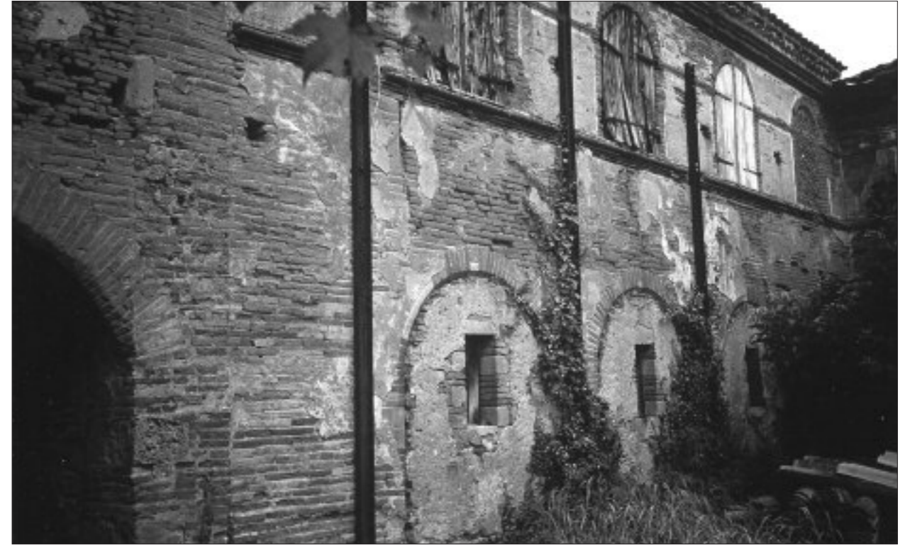
FIG. 6. CAZAUX-SAVÈS. FAÇADE POSTÉRIEURE DU BÂTIMENT, montrant les arcades de l'ancienne galerie du cloître du couvent des Minimes.

manqué de souligner la médiocrité de la pierre mise en œuvre (42).