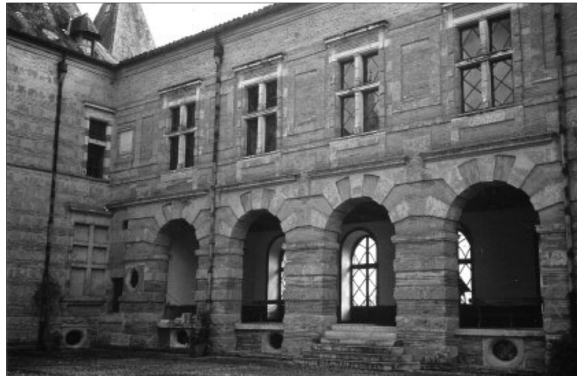
FIG. 11. CHÂTEAU DE CAUMONT. LA GALERIE OUVERTE DE L'AILE SUD.

Ces travaux n'ont pas altéré cependant les caractères communs qui rattachent Caumont à un groupe de grandes demeures contemporaines de la région, comme le château de Laréole (Haute-Garonne) (51), œuvre attestée de Dominique Bachelier (1579), et à Toulouse, la coursière et la galerie de l'Hôtel d'Assézat qui apparaissent réunies, comme ici, dans la cour (52). Les rapprochements concordants qui ont été faits avec ces ouvrages ont conduit à attribuer à Dominique Bachelier les plans d'ensemble du château de Caumont (53), de sorte que la galerie bâtie en 1612-1613 par Gilles de la Touche serait venue parfaire l'œuvre de l'architecte toulousain.