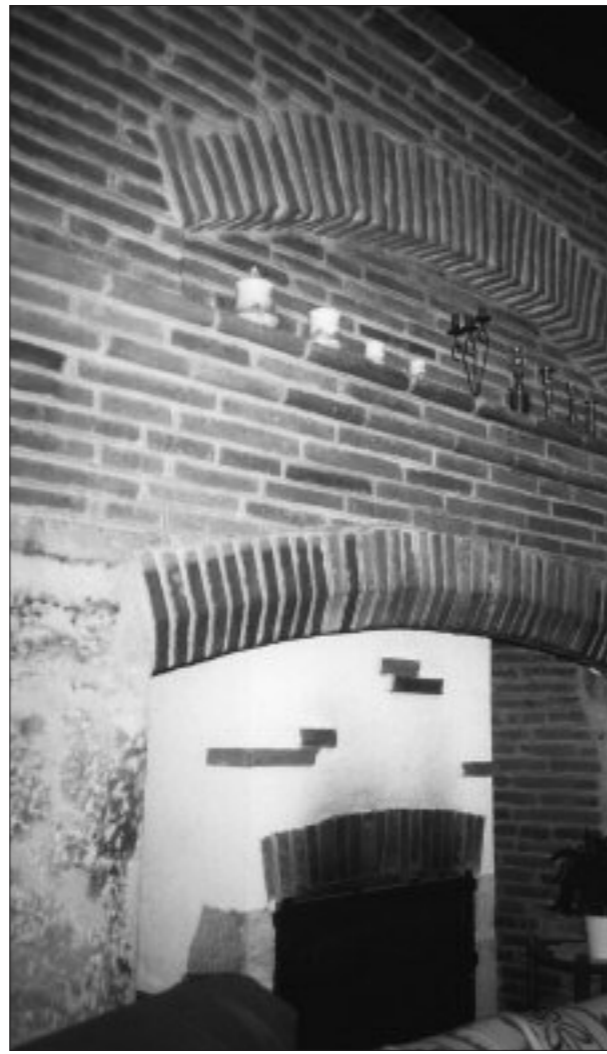
Fig. 8. CAZAUX-SAVÈS. CHEMINÉE EN BRIQUES d'une pièce du rez-de-chaussée du même bâtiment.

charpentes neuves de ces parties du château, en utilisant l'ardoise sur les toits à forte pente des pavillons et du corps de logis principal, et la tuile canal sur les toits à faible pente des ailes (45), comme le précise bien d'ailleurs l'article stipulant qu'à l'aile sud les entrepreneurs « couvriront de tuile canal à neuf la gallerie qui sera bastie et dressée dans led château suivant les attentes et desseings que y sont à présent » (46).