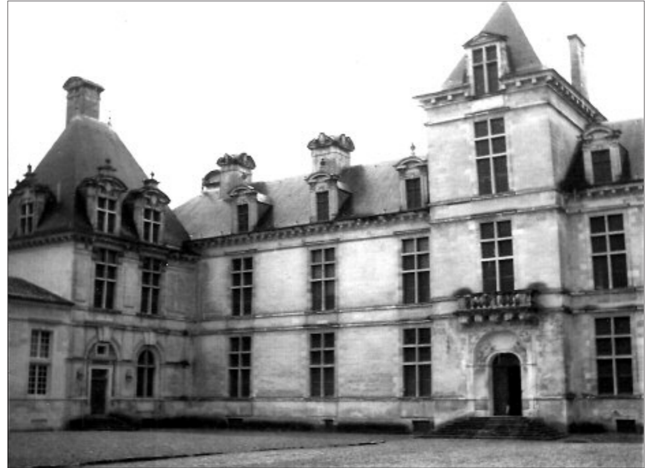
Fig. 4. CHÂTEAU DE CADILLAC. CORPS DE LOGIS PRINCIPAL (à gauche du pavillon de l'escalier se trouvent les appartements ducaux).

chantier. Mais en dépit de récentes recherches, on n'a pu découvrir le document décisif révélant le nom de l'auteur des plans du château, si bien qu'aujourd'hui les avis demeurent partagés (34). En revanche, il est établi que les premiers travaux furent dirigés effectivement par Pierre I Souffron, qui construisit le pavillon de l'escalier et la partie droite du grand corps de logis, destinée à recevoir les appartements du roi et de la reine (35).