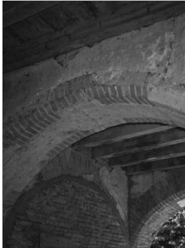
FIG. 5. CAZAUX-SAVÈS. VUE DU PASSAGE COUVERT vers l'aire de l'ancien cloître du couvent des Minimes.

fut réalisée aussi, par des artistes réputés, la décoration intérieure du château, la peinture des plafonds et des lambris, et la mise en place des cheminées monumentales qui comptent parmi les plus riches de cette époque, rehaussées de sculptures et de plaques de marbres de couleur (38).