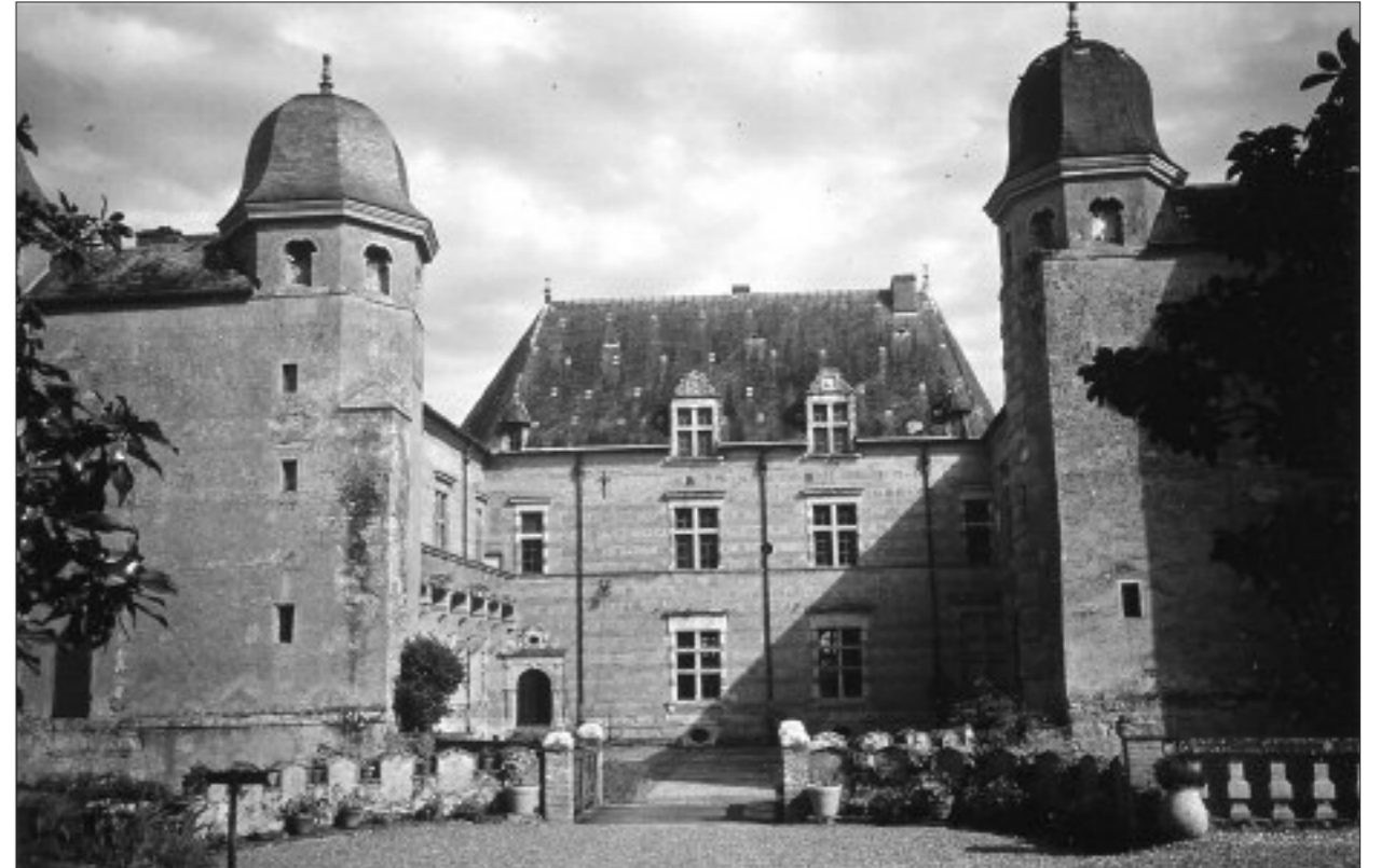
Fig. 9. CHÂTEAU DE CAUMONT. VUE DE LA COUR D'HONNEUR (à gauche façade de l'aile Nord avec la coursière).

Bien qu'il se trouvât engagé depuis longtemps dans le prestigieux chantier de Cadillac, le duc d'Épernon n'oubliait pas pour autant le château de Caumont, où il était né et avait passé sa jeunesse. À l'imitation des résidences royales, l'aménagement d'une galerie était alors de règle dans les demeures des grands seigneurs, pour leur permettre d'y recevoir fastueusement leurs invités, et l'on comprend que le premier duc d'Épernon, si fier de sa condition, ait tenu à en avoir dans ses plus chères demeures. D'ailleurs, en décidant la construction de la galerie qui était en attente à Caumont, le duc profitait de la présence de Gilles de la Touche sur place (48), pour réaliser l'achèvement du château familial. Si bien qu'une fois encore, tout comme à Cadillac, l'architecte fut chargé de continuer l'ouvrage de son prédécesseur, en prenant pour modèle à Caumont l'appareil d'assises alternées de brique et de pierre déjà employé dans l'édifice. Le délai fixé par le contrat pour la pose de la couverture l'année suivante (1613) permet de dater avec précision la construction de la galerie (49) dont les cinq arcades à bossages alternés s'intègrent harmonieusement aux façades de la cour d'honneur.