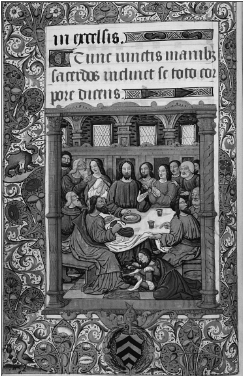
POITIERS. PONTIFICAL, REPAS CHEZ SIMON. Médiathèque François-Mitterrand, ms 822, tome II, f° 22 v°.