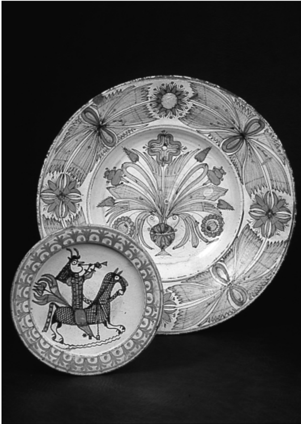
PLATS EN TERRE CUITE ÉMAILÉE DE GIROUSSENS. (Musée de Rabastens).