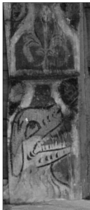
TRÈBES. ÉGLISE SAINT-ÉTIENNE, corbeaux peints.