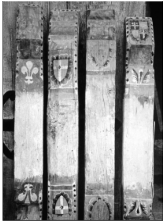
FIG. 3. ARAGON. ÉGLISE SAINTE-MARIE. Corbeaux déposés.

Les corbeaux de Saint-Étienne de Trèbes ne sont donc pas isolés et présentent un décor qui participe à une esthétique que l'on retrouve sur d'autres sites et qui témoigne de la présence d'ateliers itinérants. En effet, toutes les caractéristiques des visages de Trèbes sont aussi celles des visages des corbeaux de la charpente de Saint-Clément de Couffoulens (fig. 4). Il y a ici davantage de motifs géomé-