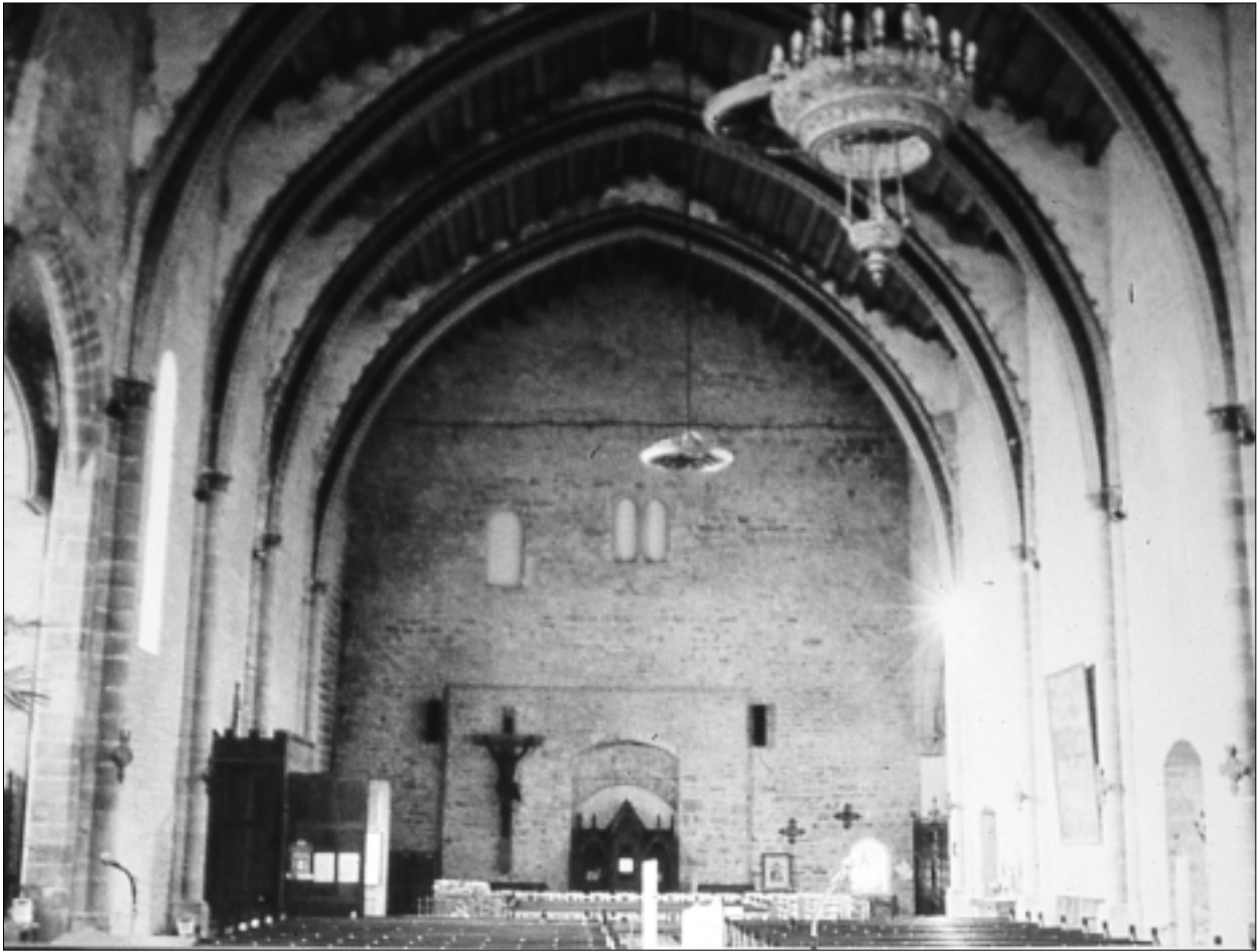
FIG. 2. TRÈBES. ÉGLISE SAINT-ÉTIENNE, vue de la nef depuis le chœur.

Ces pannes reposent sur des corbeaux. En 1860 fut mise en place la fausse voûte en plâtre et en bois qui les a cachés pendant plus d'un siècle (7).