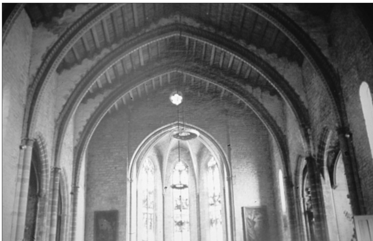
FIG. 1. TRÈBES. ÉGLISE SAINT-ÉTIENNE, vue de la nef en direction du chœur.