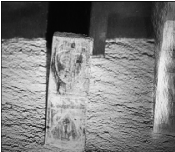
FIG. 4. COUFFOULENS. ÉGLISE SAINT-CLÉMENT. Corbeau B.10.